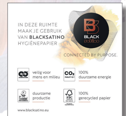
• Communicatieschildjes toiletruimte